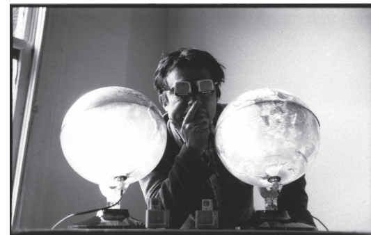
Nam June Paik a una presentazione di Good Morning Mr Orwell alla New York's Kitchen Gallery, dicembre 1983